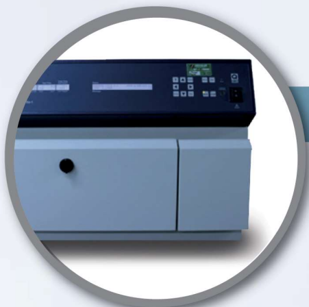
EQUIPO PARA PRUEBA DE RESISTENCIA A LA LUZ SOLAR