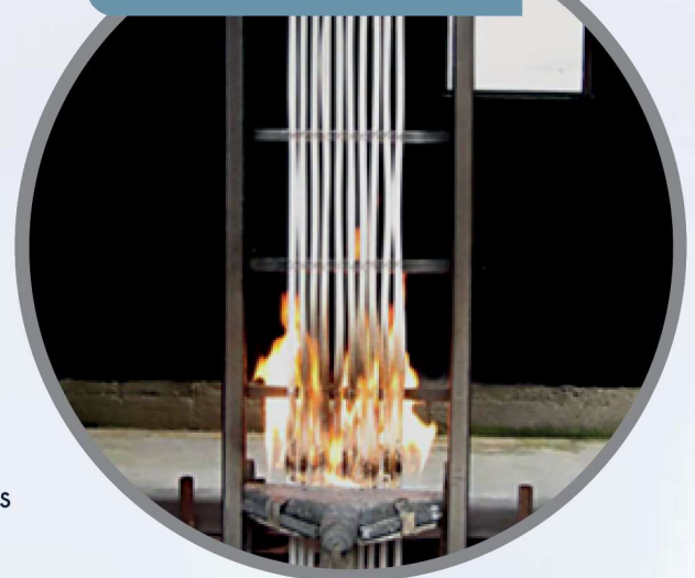
PRUEBA DE LLAMA ACORDE CON UL 1685